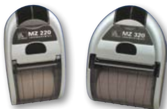
Drucker der MZ-Serie