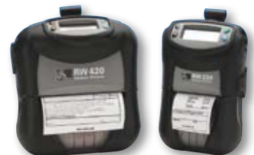
Drucker der RW-Serie

©2009 ZIH Corp. Z-Perform, Z-Select, ZebraCare sowie sämtliche Produktnamen und codes sind Marken von Zebra, und Zebra sowie die Abbildung des Zebra-Kopfs sind eingetragene Marken von ZIH Corp. Alle Rechte vorbehalten. Bluetooth ist eine eingetragene Marke von Bluetooth SIG, Inc. Alle anderen Marken sind im Besitz der jeweiligen Eigentümer.