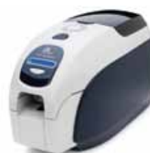
ZXP Series 3™- Kartendrucker