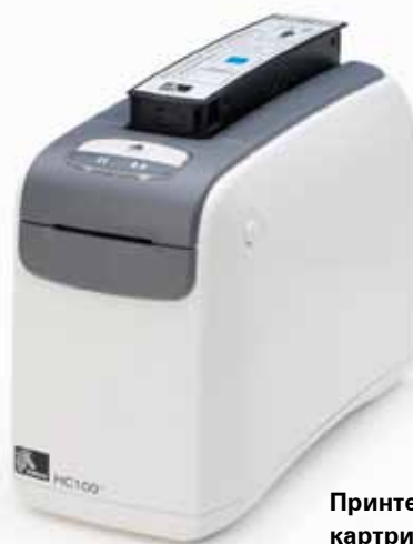
Принтер HC100 и картридж с браслетами

Отдел электронных систем Больница Raigmore, Национальная Служба Здравоохранения Великобритании, округ Хайленд