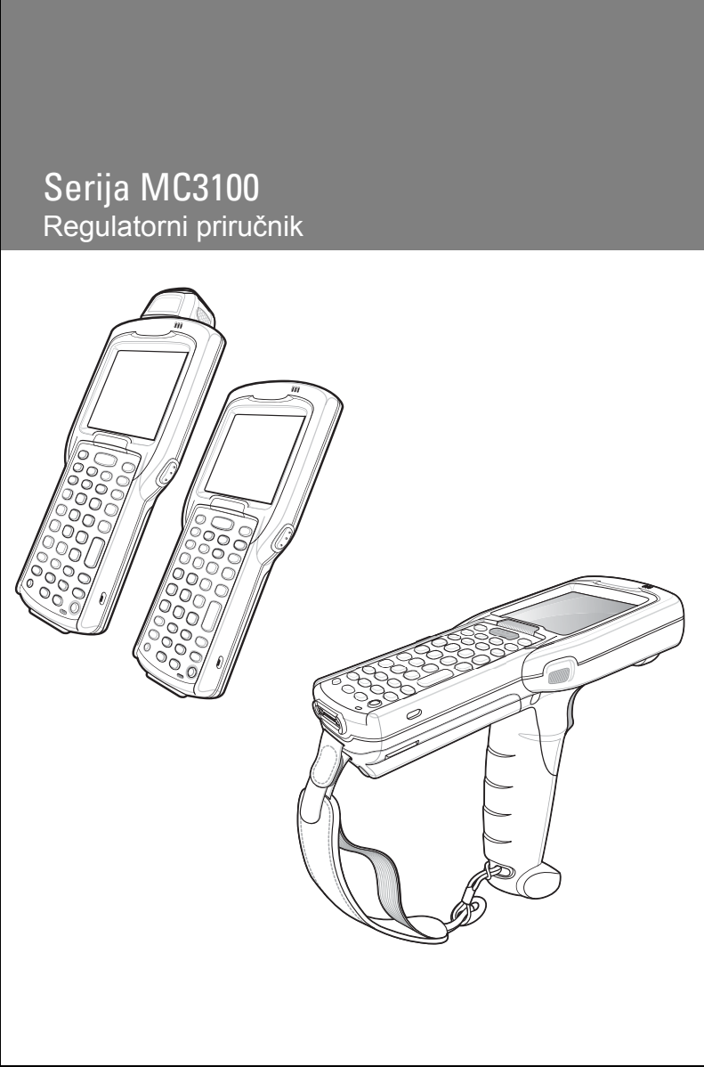
Zebra MC3100, MC3100-1, MC3100-2, MC3100-3, MC3100-4, MC3100-5, MC3100-6, MC3100-7, MC3100-8, MC3100-9, MC3100-10, MC3100-11, MC3100-12, MC3100-13, MC3100-14, MC3100-15, MC3100-16, MC3100-17, MC3100-18, MC3100-19, MC3100-20, MC3100-21, MC3100-22, MC3100-23, MC3100-24, MC3100-25, MC3100-26, MC3100-27, MC3100-28, MC3100-29, MC3100-30, MC3100-31, MC3100-32, MC3100-33, MC3100-34, MC3100-35, MC3100-36, MC3100-37, MC3100-38, MC3100-39, MC3100-40, MC3100-41, MC3100-42, MC3100-43, MC3100-44, MC3100-45, MC3100-46, MC3100-47, MC3100-48, MC3100-49, MC3100-50, MC3100-51, MC3100-52, MC3100-53, MC3100-54, MC3100-55, MC3100-56, MC3100-57, MC3100-58, MC3100-59, MC3100-60, MC3100-61, MC3100-62, MC3100-63, MC3100-64, MC3100-65, MC3100-66, MC3100-67, MC3100-68, MC3100-69, MC3100-70, MC3100-71, MC3100-72, MC3100-73, MC3100-74, MC3100-75, MC3100-76, MC3100-77, MC3100-78, MC3100-79, MC3100-80, MC3100-81, MC3100-82, MC3100-83, MC3100-84, MC3100-85, MC3100-86, MC3100-87, MC3100-88, MC3100-89, MC3100-90, MC3100-91, MC3100-92, MC3100-93, MC3100-94, MC3100-95, MC3100-96, MC3100-97, MC3100-98, MC3100-99, MC3100-100

Zebra pridržava pravo izmjena proizvoda u svrhu poboljšanja pouzdanosti, funkcija ili dizajna. Zebra ne preuzima odgovornost za proizvod koja proizlazi ili je u vezi s aplikacijom ili korištenjem bilo kojeg ovdje opisanog proizvoda, strujnog kruga ili aplikacije. Ne daje se licenca, izričita ili podrazumijevana, po načelu estopela ili na drugi način pod pravom za patent ili patentom, koja pokriva ili ima veze s bilo kojom kombinacijom, sustavom, aparatom, uređajem, materijalom, metodom ili procesom koje koriste Zebra proizvodi. Podrazumijevana licenca postoji samo za opremu, strujne krugove ili podsustave sadržane u proizvodima tvrtke Zebra.