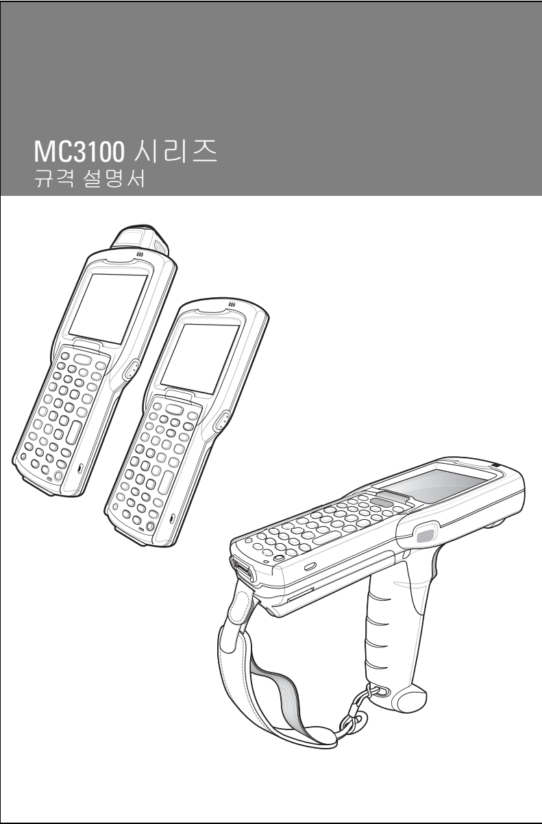
Zebra MC3100 시리즈 바코드 스캐너와 휴대용 장치.

Zebra 는 제품의 안정성, 기능, 디자인을 향상하기 위해 제품을 변경할 권리가 있습니다. Zebra 는 본 설명서에 언급된 애플리케이션이나 제품, 회로 또는 애플리케이션의 사용과 관련하여 발생하는 제품상 문제에 대해 어떠한 책임도 없습니다. 명시적/묵시적 표현, 금반언의 규칙, Zebra 제품이 사용되는 제반 공정, 시스템, 장치, 기계, 자재, 방식, 또는 이러한 요소가 결합된 것과 관련된 특허권이나 특허 등에 따라 어떠한 사용권도 허가되지 않습니다. 묵시적 사용권은 Zebra 제품에 포함된 장비, 회로, 하위 시스템에 한해서만 적용됩니다.