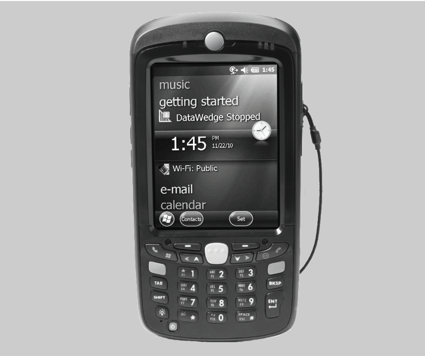
图 1 显示 Zebra 设备上的安全警告。

Zebra 保留更改任何产品以提高其可靠性、改进其功能或设计的权利。对于与任何产品、电路的应用或使用，与此处所述相悖或由此而产生的任何产品责任，Zebra 概不负责。对于可能用到 Zebra 产品的系统、仪器、机械、材料、方法或流程，或任何与 Zebra 产品组合使用的情况，Zebra 未以明示、暗示、禁反言或其它任何方式授予使用上述情况涉及到的或与之相关的专利权或专利的许可。Zebra 仅为其产品中所包含的设备、电路和子系统提供暗示许可。