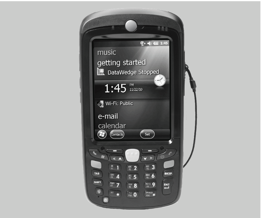
圖 1. Zebra 產品內含之設備、線路和子系統包含隱含授權。

Zebra 保留變更所有產品以提升其可靠性、功能和設計的權利。針對所有導因於或與其相關之應用或使用本文中所提及的任何產品、電路或應用程式的任何產品責任，Zebra 概不負責。在任何可能使用 Zebra 產品之狀況，包括結合、系統、裝置、機器、材料、方法、程序或與之相關的狀況下，Zebra 並未以明示、默示、禁反言或以其他方式授予專利權或專利。只有 Zebra 產品內含之設備、線路和子系統包含隱含授權。