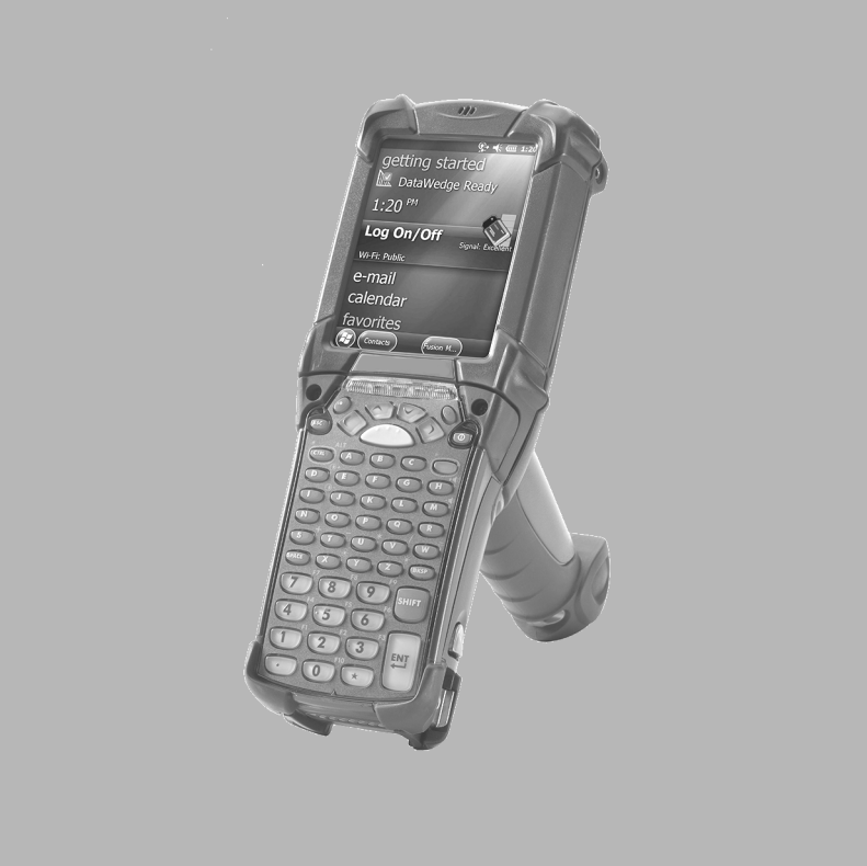
图 1-1 显示 Zebra MC9190-G 系列手持设备。

Zebra 保留更改任何产品以提高其可靠性、改进其功能或设计的权利。对于与任何产品、电路的应用或使用，与此处所述相悖或由此而产生的任何产品责任， Zebra 概不负责。对于可能用到 Zebra 产品的系统、仪器、机械、材料、方法或流程，或任何与 Zebra 产品组合使用的情况，Zebra 未以明示、暗示、禁反言或其它任何方式授予使用上述情况涉及到的或与之相关的专利权或专利的许可。 Zebra 仅为其产品所包含的设备、电路和子系统提供暗示许可。