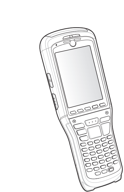
Zebra MC95XX, regulatorni priručnik, Windows Mobile 6.X

Zebra pridržava pravo izmjena proizvoda u svrhu poboljšanja pouzdanosti, funkcija ili dizajna. Zebra ne preuzima odgovornost za proizvod koja proizlazi ili je u vezi s aplikacijom ili korištenjem bilo kojeg ovdje opisanog proizvoda, strujnog kruga ili aplikacije. Ne daje se licenca, izričita ili podrazumijevana, po načelu estopela ili na drugi način pod pravom za patent ili patentom, koja pokriva ili ima veze s bilo kojom kombinacijom, sustavom, aparatom, uređajem, materijalom, metodom ili procesom koje koriste Zebra proizvodi. Podrazumijevana licenca postoji samo za opremu, strujne krugove ili podsustave sadržane u proizvodima tvrtke Zebra.