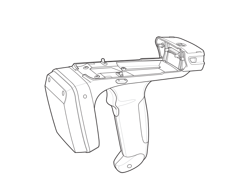
Zebra RFD5500の分解図。この図は、本体、バッテリーパック、および充電器の各部分を示しています。

Zebra は、信頼性、機能、またはデザインを向上させる目的で製品に変更を加えることができるものとします。Zebra は、本製品の使用、または本文書内に記載されている製品、回路、アプリケーションの使用が直接的または間接的な原因として発生する、いかなる製造物責任も負わないものとします。明示的、黙示的、禁反言またはその他の特許権上または特許上のいかなる方法によるかを問わず、Zebra 製品が使用された組み合わせ、システム、機材、マシン、マテリアル、メソッド、またはプロセスを対象として、もしくはこれらに関連して、ライセンスが付与されることは一切ないものとします。Zebra 製品に組み込まれている機器、回路、およびサブシステムについてののみ、黙示的にライセンスが付与されるものとします。