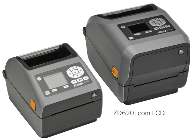
ZD620d com LCD

Quando qualidade de impressão, produtividade, flexibilidade de aplicações e simplicidade de gerenciamento são importantes, a ZD620 mostra resultados. Como a nova geração da linha de mesa da Zebra, a ZD620 substitui as populares impressoras da Série GX e a ZD500 da Zebra, ficando acima das impressoras de mesa comuns com qualidade de impressão Premium e recursos de ponta. Disponível nos modelos de transferência térmica direta e térmica, assim como modelos específicos para a área da saúde. Com mais recursos padrão que qualquer impressora de mesa da Zebra, a ZD620 foi criada para atender a uma ampla variedade de aplicações padrão. Com uma interface opcional de 10 botões com tela LCD colorida, você não precisa adivinhar a configuração e o status da impressora. A ZD620 usa o Link-OS® e nosso poderoso pacote de aplicativos, utilitários e ferramentas de desenvolvedor Print DNA, que oferece uma experiência de impressão superior com melhor desempenho, gerenciamento remoto simplificado e fácil integração. A ZD620 da Zebra: oferecendo a velocidade de impressão, qualidade de impressão e gerenciabilidade de que você precisa para continuar suas operações.