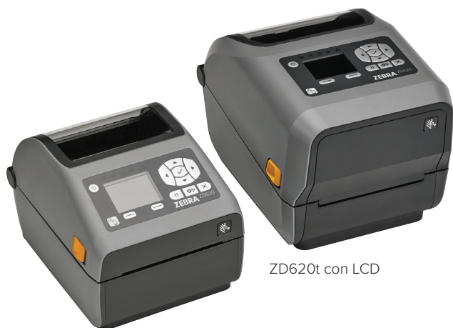
ZD620d con LCD

Cuando se trata de calidad de impresión, productividad, flexibilidad de aplicaciones y simplicidad de gestión, la respuesta está en la ZD620. Como nueva generación de la gama de impresoras de sobremesa avanzadas de Zebra, la ZD620 sustituye a las exitosas impresoras GX Series y ZD500 de Zebra, destacando sobre las impresoras de sobremesa convencionales por su calidad de impresión premium y sus funciones de tecnología punta. La ZD620, disponible en modelos de impresión térmica directa y de transferencia térmica, así como en modelos específicos para atención sanitaria, atiende las necesidades de una gran variedad de aplicaciones. Ofrece de serie más funciones que ninguna otra impresora de sobremesa Zebra, además de una interfaz de usuario opcional de 10 botones con LCD en color que permite despejar cualquier duda acerca de la configuración y el estado de la impresora. La ZD620 ejecuta Link-OS® y cuenta con el respaldo de nuestro potente paquete de aplicaciones, utilidades y herramientas para desarrolladores Print DNA, que proporcionan una experiencia de impresión superior mediante un rendimiento más alto, una gestión remota más simple y una integración más sencilla. ZD620 de Zebra: ofrece la velocidad y calidad de impresión y la facilidad de gestión de impresoras necesarias para que sus operaciones sigan progresando.