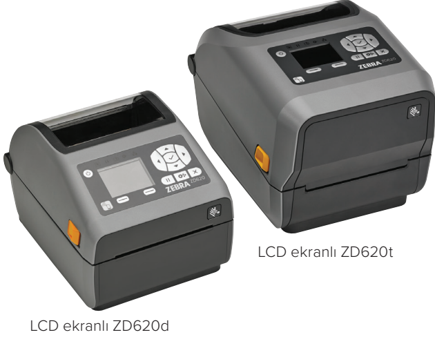
LCD ekranlı ZD620d

Baskı kalitesi, üretkenlik, uygulama esnekliği ve yönetim basitliği önemli olduğunda, Zebra ZD620 bunları sunar. Zebra'nın yeni nesil masaüstü yazıcılarında olduğu gibi, ZD620, Zebra'nın popüler GX Series ve ZD500 yazıcılarının yerini alıyor ve süper baskı kalitesi ve son teknoloji özellikleriyle, geleneksel masaüstü yazıcıların ötesine geçiyor. Direkt termal ve termal transfer modellerinde ve sağlık bakım alanına özel modellerde mevcut olan ZD620, birçok uygulama gereksinimlerini karşılıyor. Bu model, opsiyonel 10 düğmeli kullanıcı arayüzünü, Zebra masaüstü yazıcıların standart özelliklerini ve renkli LCD özelliklerini sunuyor ve yazıcı kurulum ve durumuna bakarak tahmini işi anlamanızı sağlıyor. ZD620 yazıcı, Link-OS® kullanmaktadır ve daha iyi performans, basitleştirilmiş uzaktan yönetilebilirlik ve daha kolay entegrasyon özellikleri sayesinde üstün yazdırma deneyimi sunan güçlü Print DNA uygulamalarımız, yardımcı yazılımlarımız ve geliştirici araçlarımız tarafından desteklenmektedir. Zebra ZD620 — operasyonlarınızı sürdürmek için ihtiyaç duyduğunuz baskı hızı, baskı kalitesi ve yazıcı yönetilebilirliğini sunuyor.