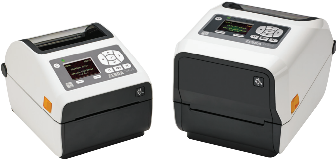
LCD ekranlı ZD620d-HC

Bir sağlık sektörü hizmet sağlayıcısı olarak, sağlık sektörü çalışanlarınıza hasta bakımında günün her saniyesi en iyi hizmeti verebilmelerini mümkün kılacak araçları sağlamanız gerekir. Zebra'nın ZD620-HC yazıcısı süper baskı kalitesi ve son teknoloji özellikleriyle, geleneksel masaüstü yazıcıların ötesine geçiyor. Doğrudan termal ve termal transfer modellerinde mevcut olan ZD620 modeli, Zebra masaüstü yazıcıların standart özelliklerinin yanısıra, yazıcı kurulum ve durumunu kolaylaştıran opsiyonel bir renkli LCD ve 10 düğmeli kullanıcı arayüzüne sahip. Sağlık sektörü için tasarlanan ZD620-HC yazıcı, sürekli enfeksiyon bulaşmasına hazırdır ve sağlık sektörüne uygun bir güç kaynağı sunmaktadır. Opsiyonel 300 dpi baskı ile, en küçük etiketler bile net ve okunaklıdır. ZD620 yazıcı, Link-OS® kullanmaktadır ve daha iyi performans, basitleştirilmiş uzaktan yönetilebilirlik ve daha kolay entegrasyon özellikleri sayesinde üstün yazdırma deneyimi sunan güçlü Print DNA uygulamalarımız, yardımcı yazılımlarımız ve geliştirici araçlarımız tarafından desteklenmektedir. Zebra ZD620 — verimliliği, hatasızlığı ve bakım kalitesini sürdürmek için ihtiyaç duyduğunuz baskı hızı, baskı kalitesi ve yazıcı yönetilebilirliğini sunuyor.