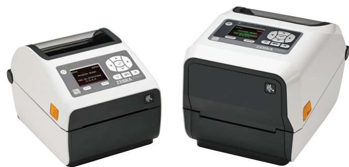
ZD620d-HC с ЖК-дисплеем