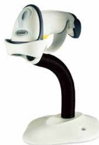
インテリスタンド (別売)